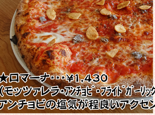
★ロマーナ・・・¥1,430 (モッツアレラ・アンチョビ・ホワイトガーリック) アンチョビの塩気が程良いアクセント