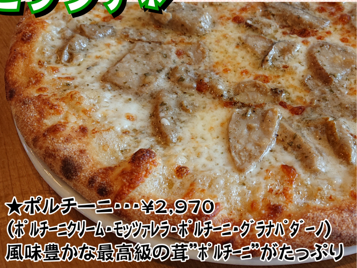
★ポルチーニ・・・¥2,970 (ポルチーニクリーム・モッツアレラ・ポルチーニ・グラナパダーノ) 風味豊かな最高級の茸“ポルチーニ”がたっぷり