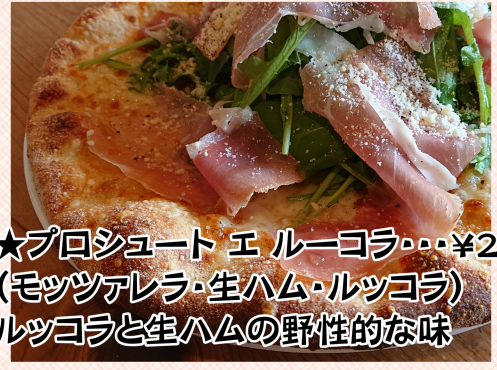
★プロシュート エルーコラ・・・¥2,398 (モッツアレラ・生ハム・ルッコラ) ルッコラと生ハムの野性的な味