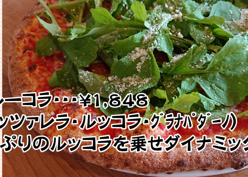
★ルーコラ・・・¥1,848 (モッツアレラ・ルッコラ・グラナパダーノ) たっぷりのルッコラを乗せダイナミックに