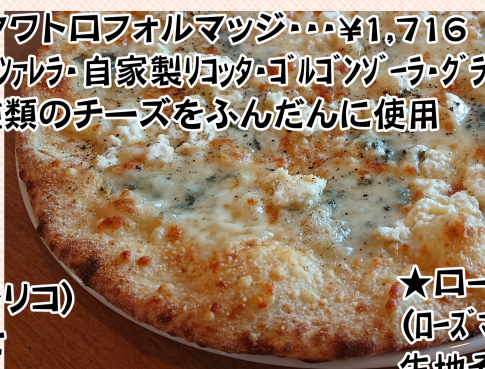
★クワトロフォルマッジ・・・¥1,716 (モッツアレラ・自家製リコッタ・ゴルゴンゾーラ・グラナパダーノ) 4種類のチーズをふんだんに使用