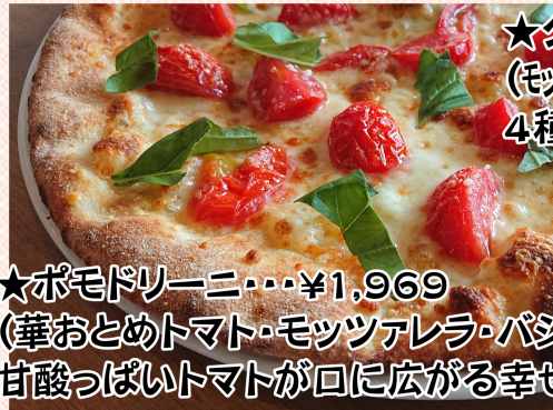
★ポモドリーニ・・・¥1,969 (華おとめトマト・モッツアレラ・バジリコ) 甘酸っぱいトマトが口に広がる幸せ