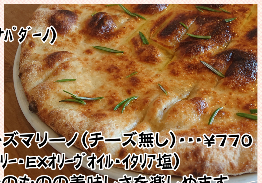
★ローズマリーノ(チーズ無し)・・・¥770 (ローズマリー・EXオリーブオイル・イタリア塩) 生地そのものの美味しさを楽しめます