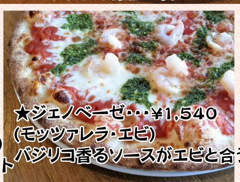
★ジェノベーゼ・・・¥1,540 (モッツアレラ・エビ) バジリコ香るソースがエビと合う