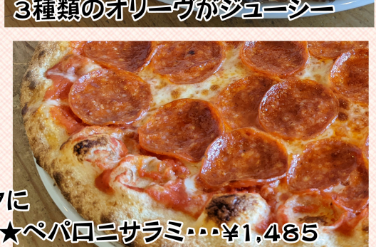
★ペパロニサラミ・・・¥1,485 (ペパロニサラミ・モッツアレラ) スパイシーなサラミはみんな大好き