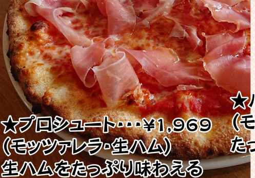
★プロシュート・・・¥1,969 (モッツアレラ・生ハム) 生ハムをたっぷり味わえる