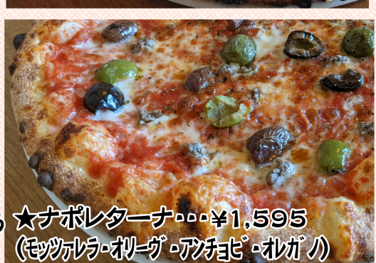
★ナポレターナ・・・¥1,595 (モッツアレラ・オリーブ・アンチョビ・オレガノ) 3種類のオリーブがジューシー